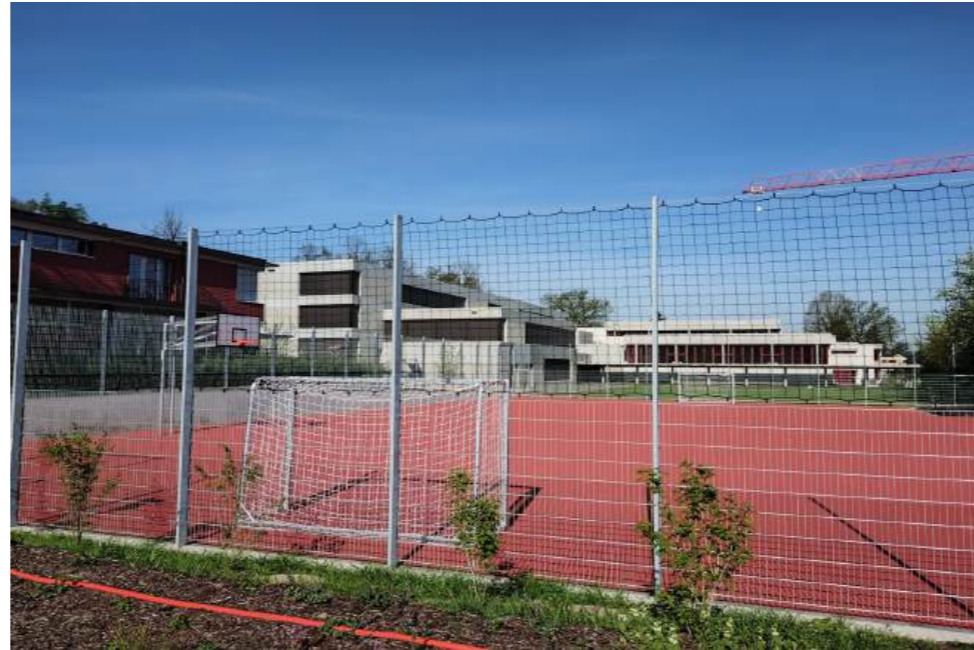
Neuer Allwetterplatz mit Ballfangnetzen an allen vier Seiten