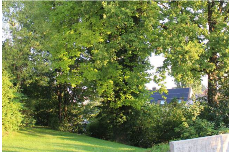
Hauptplatz mit geteertem Weg und frisch gesätem Rasen