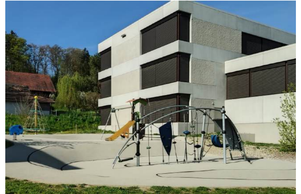
Vielfältige und spannende Spiel- und Kletterelemente für die Kindergartenkinder