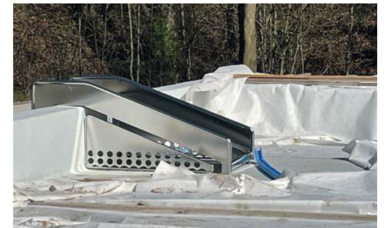
Individuell für diese Anlage hergestellte Kinder-Wasserrutsche (ChristianENZler)