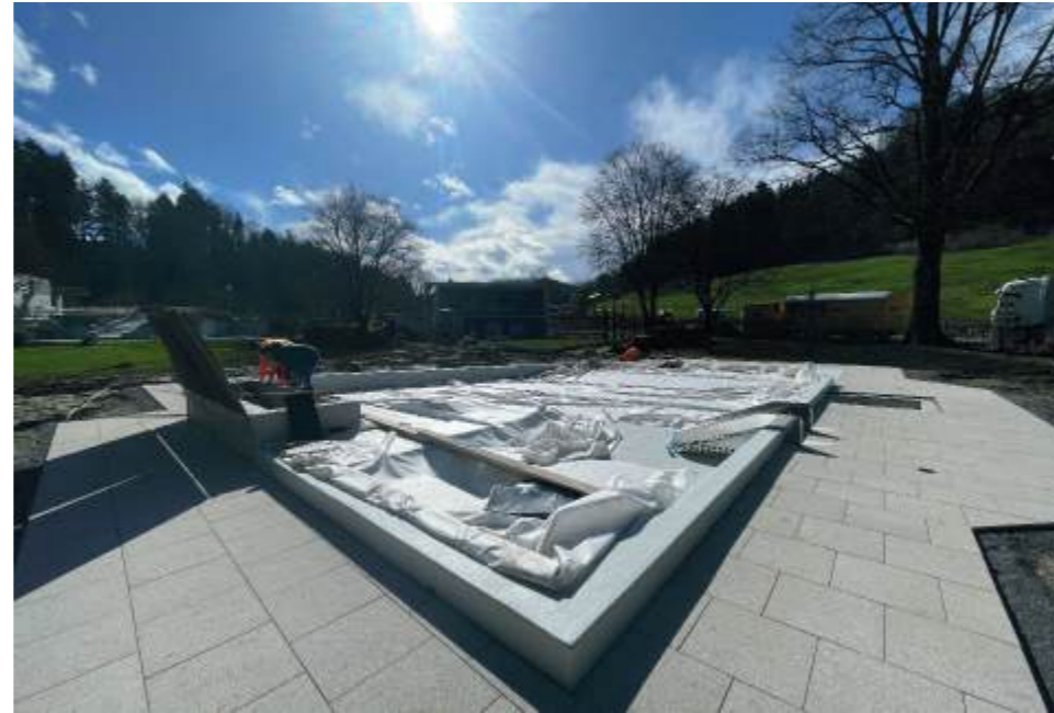
Kinderbad mit Rutschbahn von der tiefen Seite, Stand 27.3.24