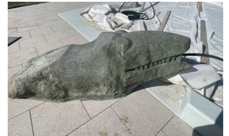
Wasserspeiendes Kunstwerk im Kinderbad integriert