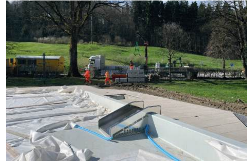
Spezial-angefertigte Rutschbahn von ChristianENZler, montiert