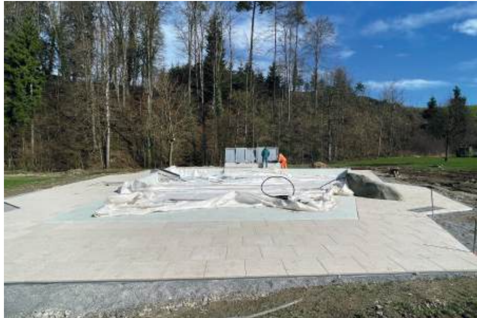
Sicht auf das Kinderbad von der seichten Seite, Stand 27.3.24