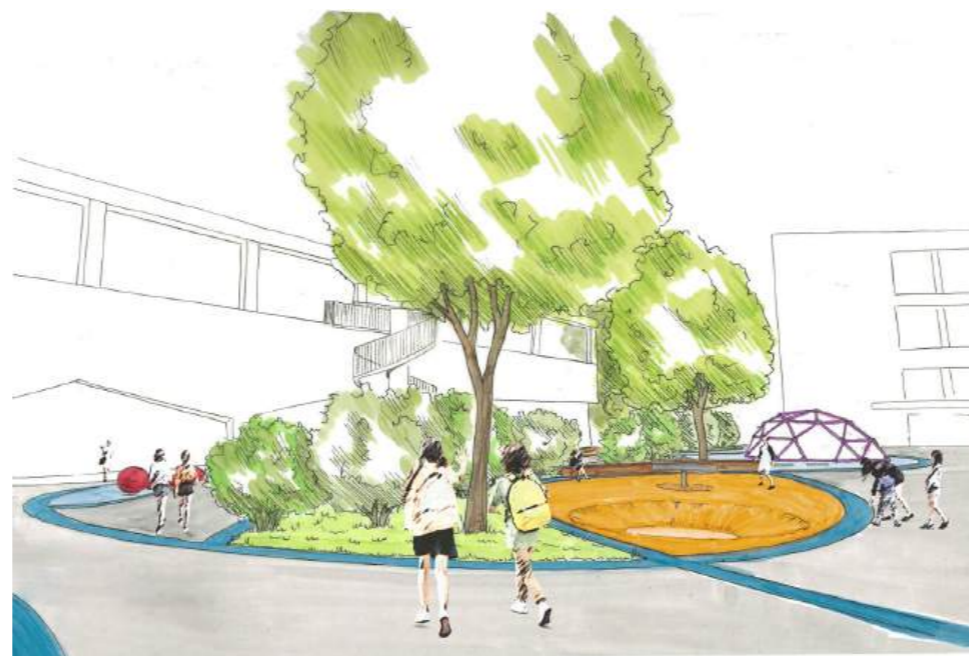
Perspektive der Mulde und Bepflanzung

Ein prägendes System aus geschwungenen blauen Pflasterbändern gliedert den Hof, verbindet die Gebäude visuell und schafft abwechslungsreiche Teilräume. Aus den sich schneidenden Bändern bilden sich Teilbereiche, die verschieden gefüllt bzw. bepflanzt sind. Farbige, wasserdurchlässige Fallschutzbeläge, modellierte Bodenformen und vielfältige Spiel- und Bewegungsangebote fördern Aktivität ebenso wie Rückzug und Aufenthalt. Die naturnahe Bepflanzung mit standortgerechten Gehölzen und Stauden bringt eine vertikale und ökologische Qualität in den Raum. Ein durchdachtes Entwässerungskonzept mit Versickerung vor Ort, die Nutzung der Mulde als Schneelager sowie die Sicherstellung der Befahrbarkeit für den Winterdienst ergänzen die Gestaltung funktional. Dieser farbenfrohe, vielseitige und sichere Pausenplatz führt zu Pausen, die von spielerischem, friedlichem und bewusstem Austausch zwischen den Schülern geprägt sind.