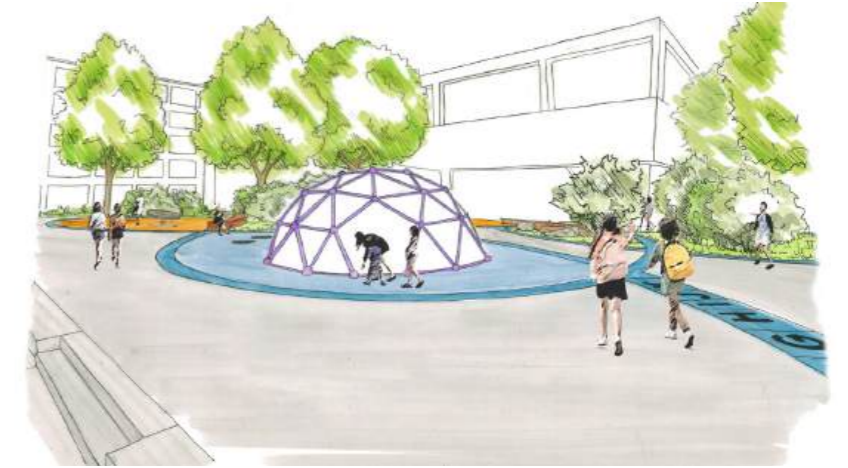
Perspektive der Kletterkugel und der blauen Pflasterbänder